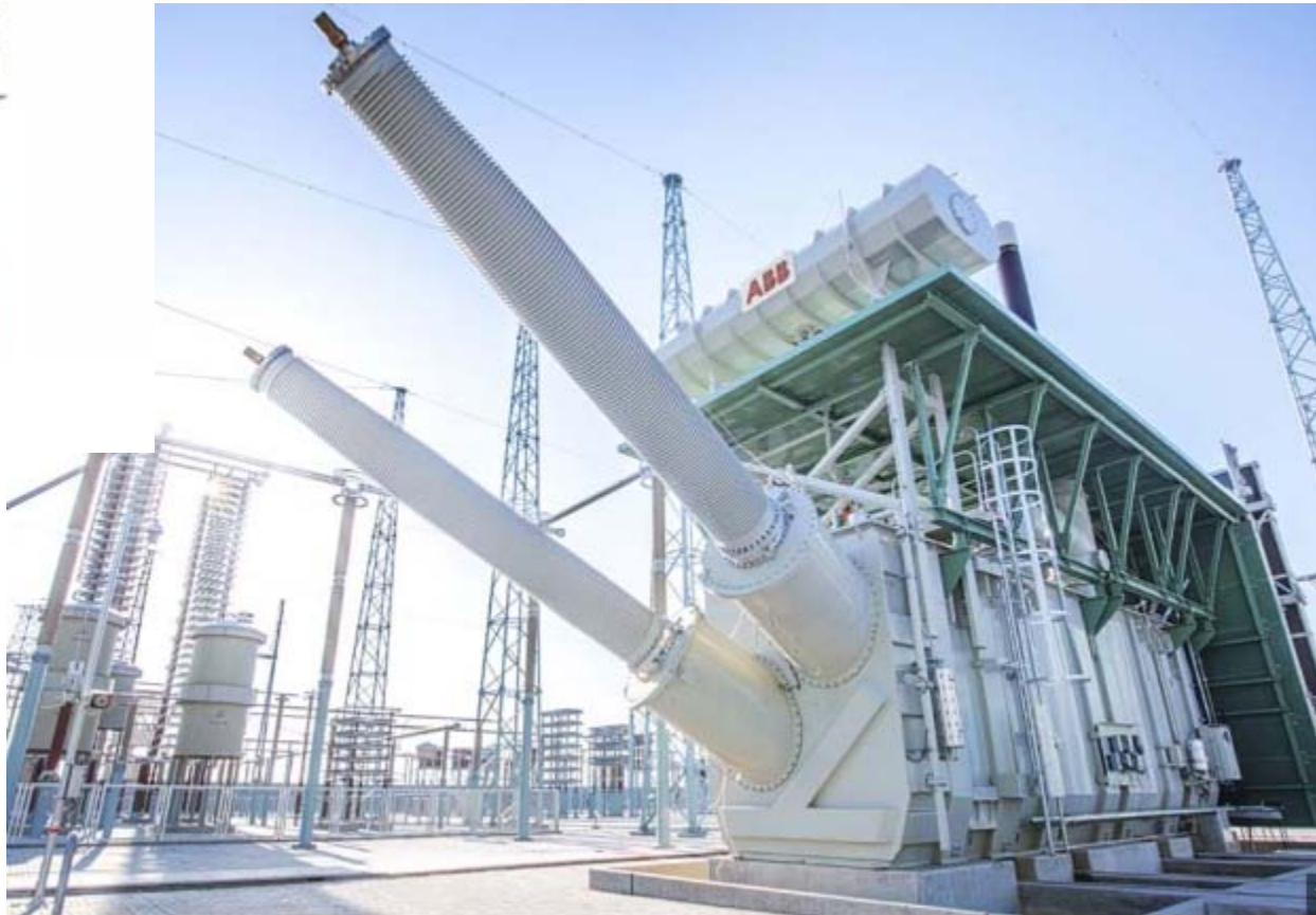
On-load tap-changer, type UCC